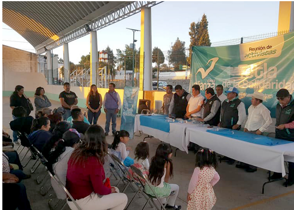
Tetla de la Solidaridad