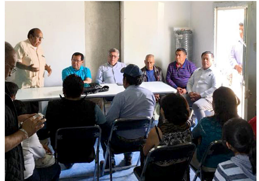
Santa Cruz Tlaxcala