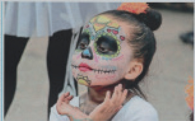
Las niñas con maquillaje tradicional indígena en la feria cultural que vive Tepic, Jalisco.