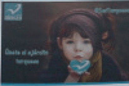
Quinta etapa del proceso electoral.