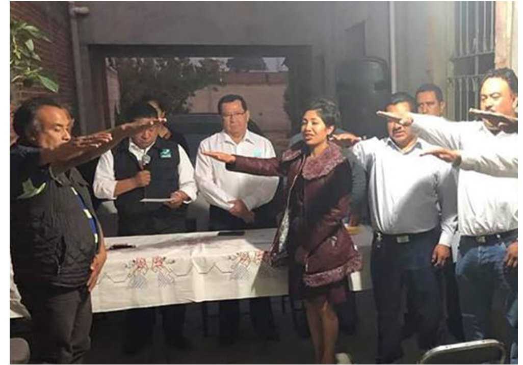
San Juan Huactzinco