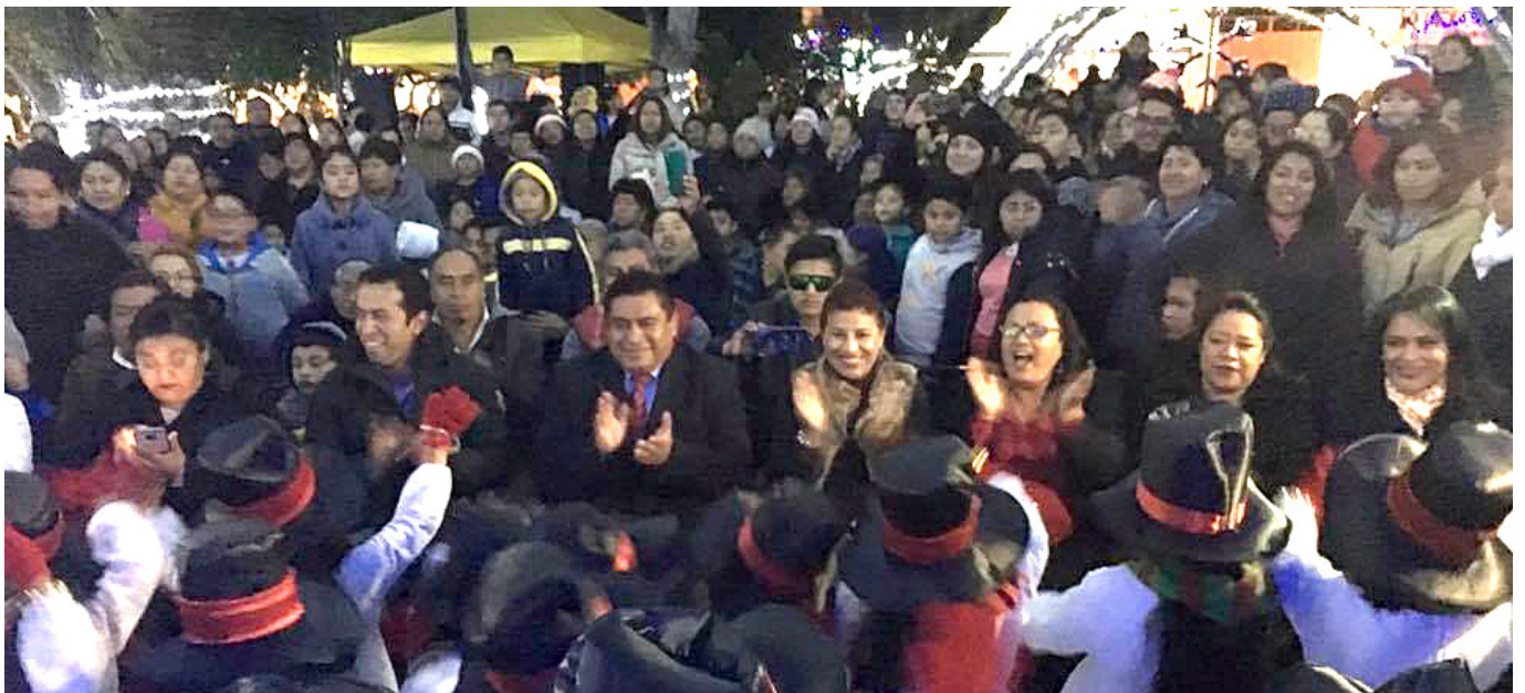
Festejo decembrino en Tepeyanco