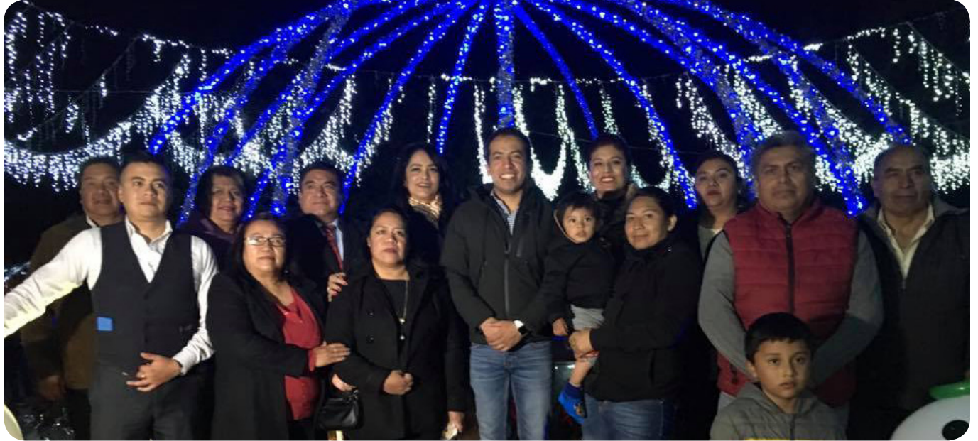
Encendido del árbol de Navidad